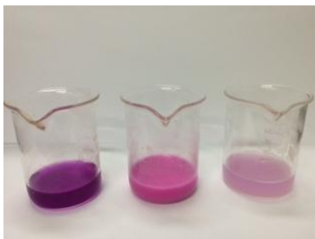
Figura 04: Amostras aquecidas. Fonte: Dados da pesquisa.

O aquecimento foi realizado para simular o aquecimento similar ao que ocorre com uma prancha de aquecimento utilizada para modelar o cabelo, recurso muito utilizado pelos salões de beleza. Verificou-se o aumento na intensidade da coloração, ou seja, o indicativo de que o alisante capilar em contato com o calor da prancha de modelar proporciona um aumento da concentração do formaldeído, como mostra a figura 04.