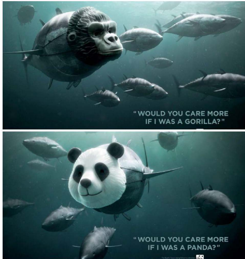
Prévia das imagens.